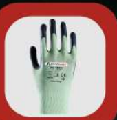
KESİLMEME DİRENÇLİ ELDİVENLER // CUT RESISTANT GLOVES