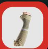
KESİLMEME VE ISI DİRENÇLİ KOLLUKLAR // CUT & HEAT RESISTANT SLEEVES