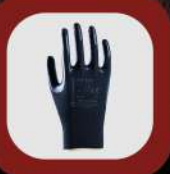
YAĞLI ORTAM ELDİVENLERİ // OILY ENVIRONMENT GLOVES