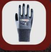
MONTAJ ELDİVENLERİ // ASSEMBLY GLOVES