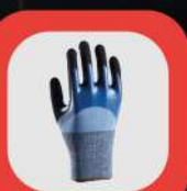
ÇOK YAKINDA // COMING SOON